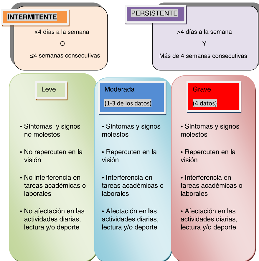
Figura 1. Clasificación de Conjuntivitis Alérgica, propuesta en el documento DECA

Los desencadenantes principales de la respuesta alérgica en la conjuntiva al igual que ocurre en las mucosas respiratorias, incluyen a los pólenes, los epitelios de animales, las esporas de hongos, los ácaros.... En su fisiopatología también se distingue una fase aguda o inmediata a la exposición, por la desgranulación de los mastocitos y una fase crónica o tardía con fenómenos de inflamación (6). La sintomatología (prurito, hiperemia